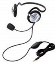
4極ミニプラグ ※Ipad推奨