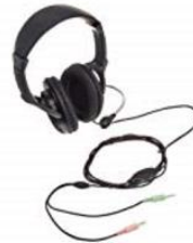
3極ステレオミニプラグ × 2 (マイク付)